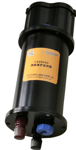
图 1. CST460 阴极保护腐蚀监测仪

CST460 阴极保护与腐蚀综合监测系统集成了 精密电阻腐蚀监测与阴极保护参数监测 两个模块，通过将腐蚀监测传感器、长效参比电极和数据采集存储电路一体化设计，可用于阴保状态下金属试片的腐蚀在线监测，以及埋地管道的保护电位、干扰电位、自腐蚀电位、通电电位、断电电位和保护电流等多种阴保参数监测。本监测仪采用圆柱形设计可通过卡箍固定在测试桩内。所配置的 ER 探头则采用与埋地管道相同的材质，并采用防水结构设计，可直接埋入地下，并与受保护金属结构实现电连接。通过远程测量受保护试片的腐蚀余量和腐蚀速率，可以对阴极保护效果进行实时检验，避免了传统上采用失重埋片法的繁琐过程。