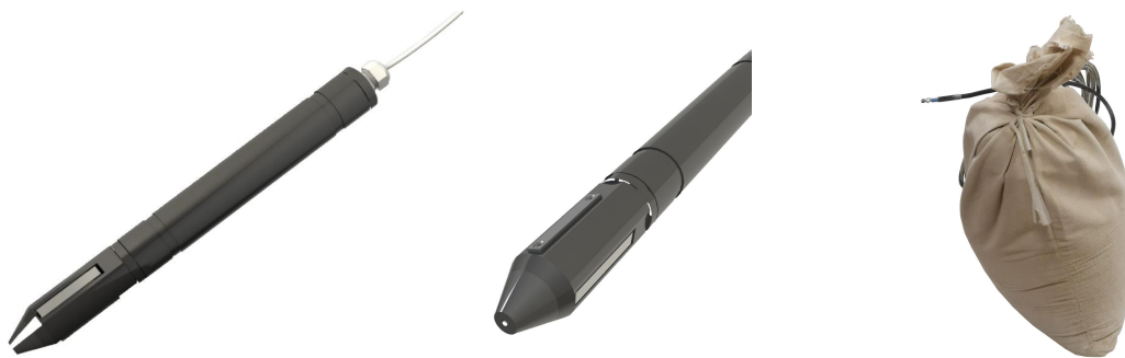
图 2.埋地 ER 腐蚀监测探头（侧面同时安装失重测试片）及硫酸铜参比电极（含填料包）

CST460 腐蚀监测模块采用欧姆电阻（ER）测量原理，通过测量与主体结构电连接的金属试片的电阻增量，来计算测试片的腐蚀总量和腐蚀速率，避免了阴极保护下试样无法采用电化学极化测量腐蚀速率的重要缺陷。采集器采用高精度低功耗 24 bit AD 转换器，并利用专利的交流激励源技术和 AV 电桥原理，实现了高分辨的微电阻测量。仪器内置的阴极保护测量模块，内置四路差分电压和一路电流采集通道，可测量阴极保护状态下埋地钢管的保护电位，以及测试片的自然腐蚀电位和保护电流。仪器内置继电器控制电路，可在时序控制下瞬间断开埋地试片与钢管的电连接，延迟测量钢片的断电电位。仪器工作原理如图 3。