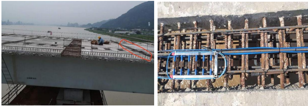
图 4. 温州七都大桥桥面伸缩缝内安装的多只阳极梯