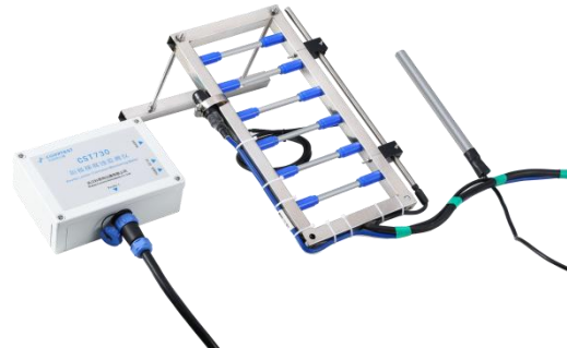
图 1. 阳极梯腐蚀监测仪

在混凝土腐蚀过程中，随着 CO 2 、氯离子和水分向内侵入，导致混凝土的腐蚀锋面不断向内延伸，随着腐蚀锋面深度增加，阳极梯上距离表层不同距离的阳极阵列的电极电位、电偶电流和阻抗值均会发生明显的变化。通过不同深度的阳极阵列电化学参数随时间和位置的变化曲线，可以计算混凝土碳化深度随时间的变化规律，预测混凝土中钢筋的锈蚀时间，为混凝土结构的预防性维护提供指导。