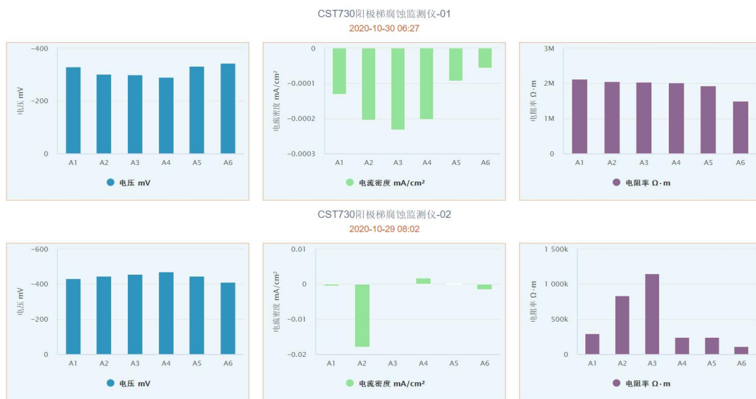
图 5. 阳极梯监测的钢筋自腐蚀电位、钢筋阻抗和电偶电流监测数据