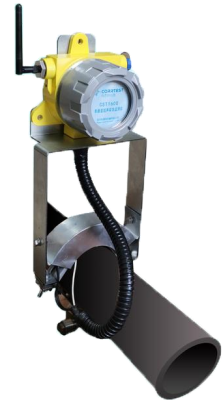
图 1.CST1600 超声波腐蚀监测仪