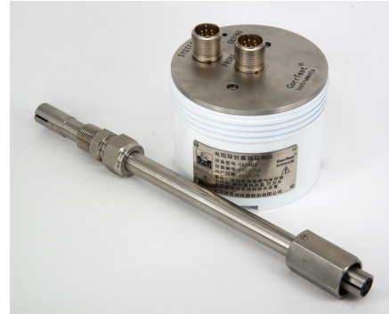
图 1. CST400C 电阻腐蚀监测仪

供电方式为大容量锂电池或 DC12V 供电。低功耗设计可以保证仪器内置的大容量锂电池持续工作 400 天以上。亦可利用太阳能电池系统或接入 220V 市电，转换为 DC12V 供电。