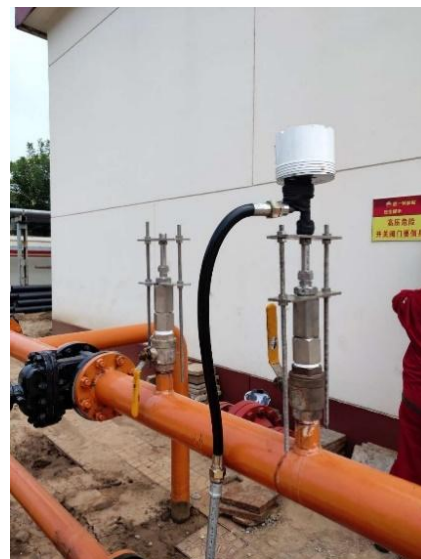
图 2. CST400C 电阻腐蚀监测仪安装现场